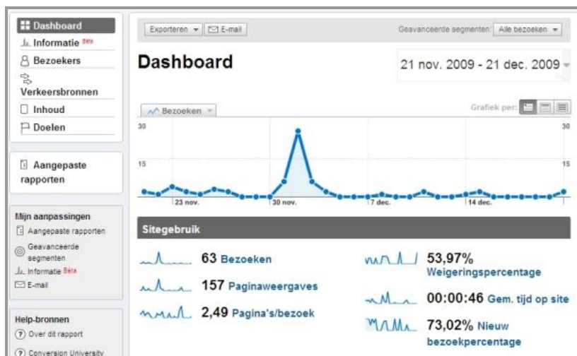
Google Analytics dashboard

Uw website is standaard voorzien van geavanceerde en zeer uitgebreide statistieken met behulp van Google Analytics, waarmee u het bezoek aan uw website kunt monitoren.